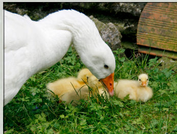
Diepholzer Gans mit Küken